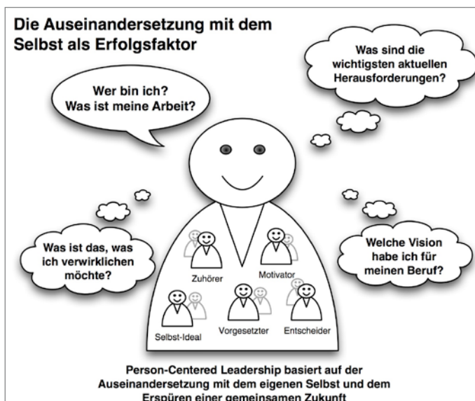
Abbildung 1: Die Auseinandersetzung mit dem Selbst

Meditative Techniken können dabei helfen, die Auseinandersetzung mit dem Selbst zu ermöglichen. Gerade Führungskräfte, die unter hohem (Erfolgs-) Druck stehen und Veränderungsprozesse initiieren wollen, brauchen innere Räume der Ruhe, um leistungs- und widerstandsfähig zu bleiben.