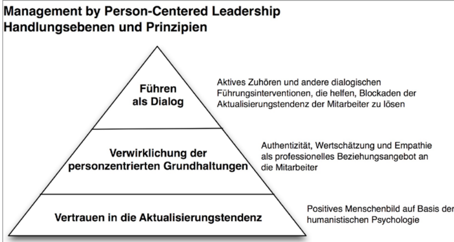
Abbildung 2: Handlungsebenen im PCL (nach Kunze, 2007)

ungsstile und Methoden empfehlenswert, die helfen, Blockaden der Aktualisierungstendenz (einzelner Mitarbeiter oder die des Teams) zu beseitigen (Kunze, 2006).