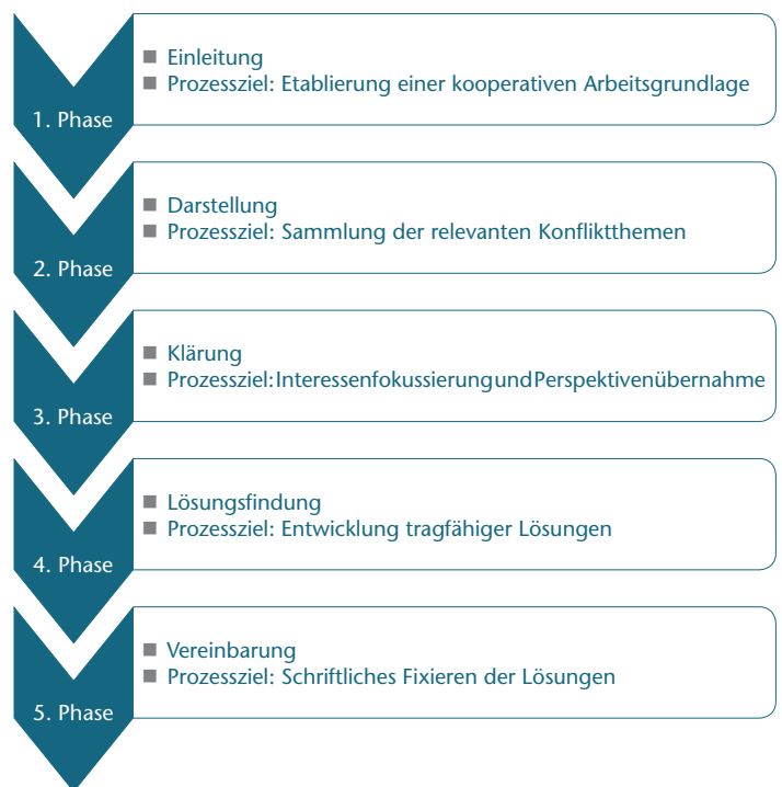
Abb. 2: Phasen der Mediation (Frohn, 2013 a)

Das Prozessziel der Durchführung besteht in der Mediation selbst, jedoch lassen sich für deren einzelne Phasen erneut Prozessziele definieren (Frohn, 2013 a).